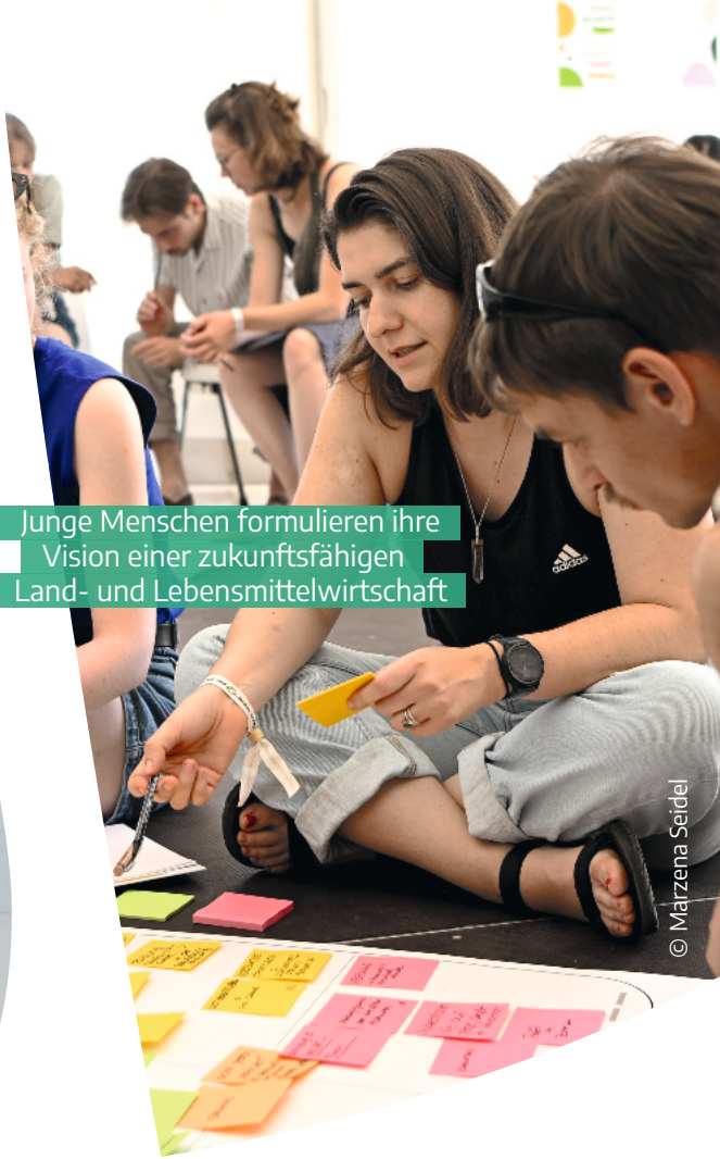
Junge Menschen formulieren ihre Vision einer zukunftsfähigen Land- und Lebensmittelwirtschaft