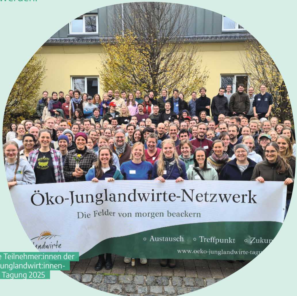
Die Teilnehmer:innen der Öko-Junglandwirt:innen- Tagung 2025

Die 19. Öko-Junglandwirt:innen-Tagung beschäftigte sich mit der Frage, wie zukünftige Arbeits- und Lebenswelten auf Bio-Höfen aussehen werden.