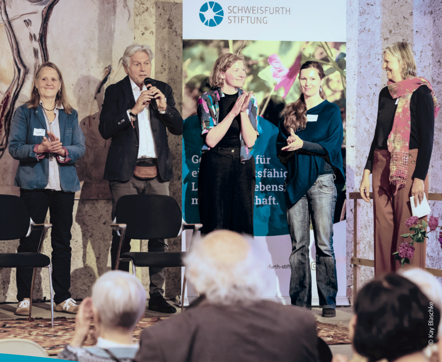
Das Kuratorium stellt sich beim 40-jährigen Jubiläum der Schweisfurth Stiftung auf der Bühne vor