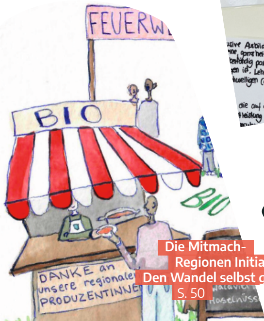
Die Mitmach-Regionen Initiative: Den Wandel selbst gestalten S. 50