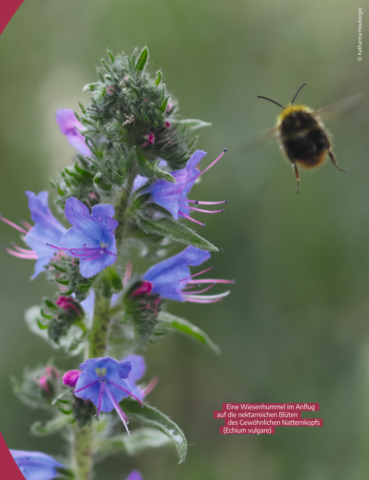
Eine Wiesenhummel im Anflug auf die nektarreichen Blüten des Gewöhnlichen Natternkopfs ( Echium vulgare )