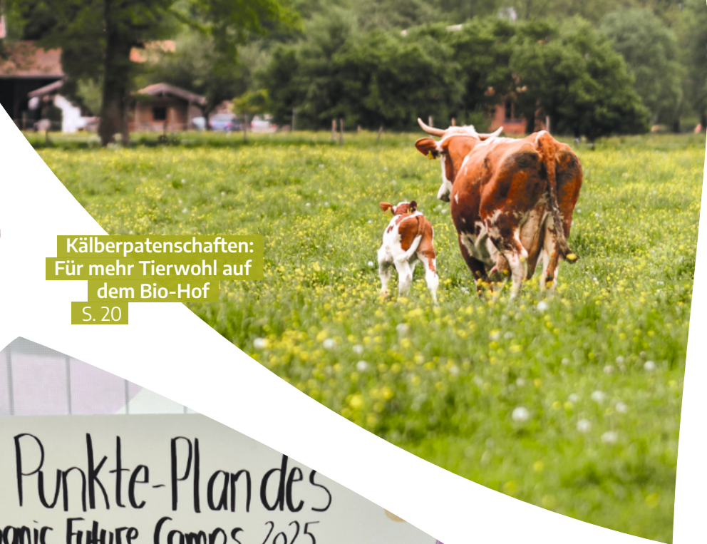
Kälberpatenschaften: Für mehr Tierwohl auf dem Bio-Hof S. 20