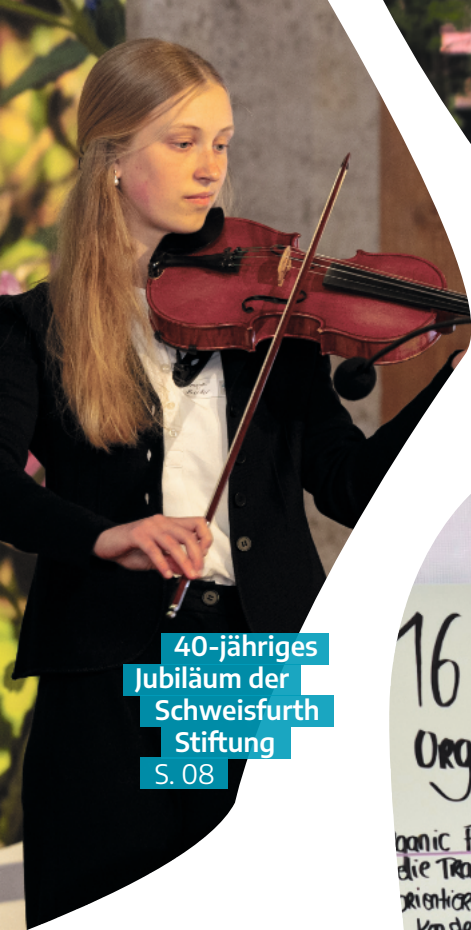
40-jähriges Jubiläum der Schweisfurth Stiftung S. 08